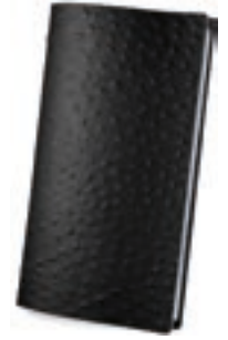
Avestruz Negro 1,2 mm