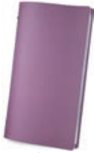
Violeta 1,2 mm