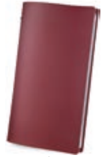
Burdeos 1,2 mm