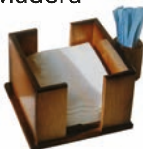
Cod. 140301 Con palillero