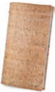
Natural 1,4 mm