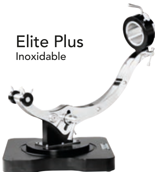
Elite Plus Inoxidable

9256 Color Natural 6293 Color Tabaco 8105 Color Roble