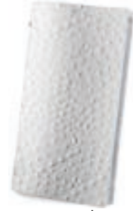
Avestruz Blanco 1,2 mm