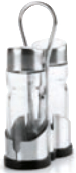
Basic Cod. 62866