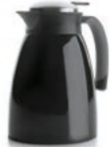
Servidor Termo D/Pared