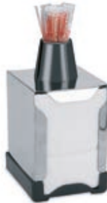
Cod. 8061 Inox - Base plástico Palillero Negro