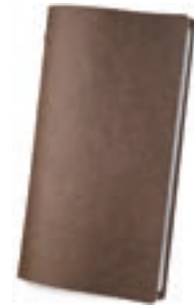
Marrón 0,8 / 1,5 mm