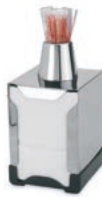
Cod. 8063 Inox - Base plástico Palillero Cromado