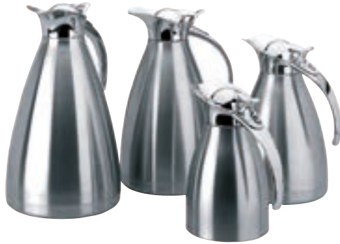
Jarra Termo Luxe