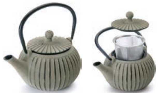
Tetera Hierro Nepal