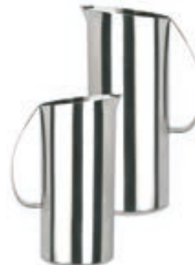
Jarra Oval Inox