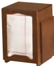
Cod. 25002 Con portacartas