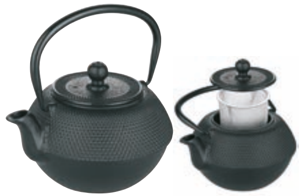
Tetera Hierro Negra