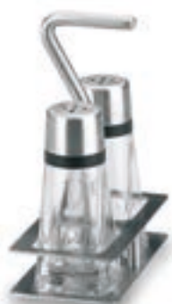
Hiperlux Cod. 62461