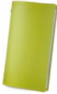
Verde 1,2 mm