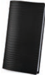
Cocodrilo Negro 1,2 mm