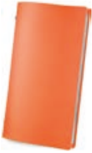
Naranja 1,2 mm