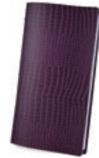
Cocodrilo Violeta 1,2 mm