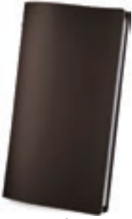
Marrón 1,2 mm