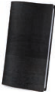
Negro 2,5 mm