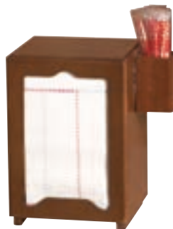
Cod. 25020 Con palillero