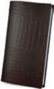
Cocodrilo Marrón 1,2 mm