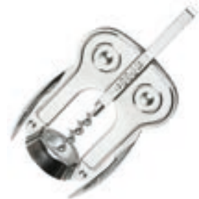
Sacacorchos Doble Palanca Cod. 63013