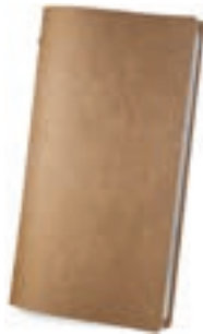
Natural 0,6 / 0,8 mm