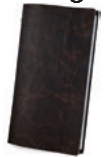
Marrón 0,5 / 1,0 mm