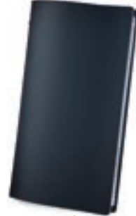
Azul 1,2 mm