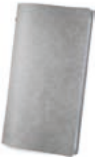
Gris 0,6 / 1,5 mm