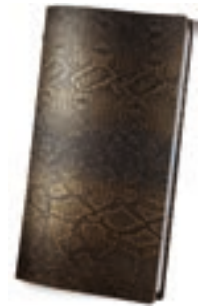
Marrón 1,2 mm