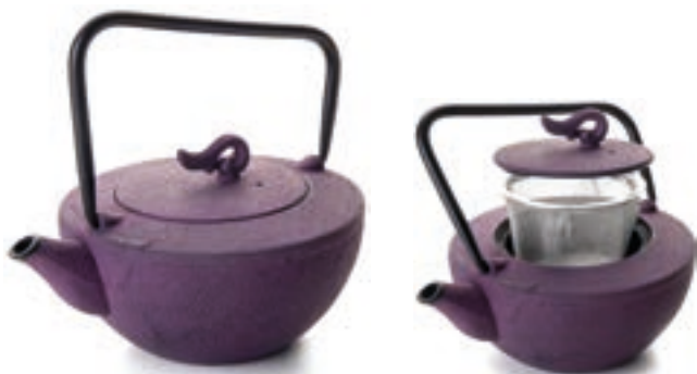
Tetera Inox Tokio