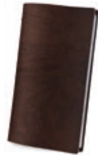
Marrón 2,5 mm