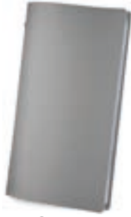
Gris 1,2 mm