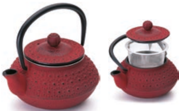
Tetera Hierro Hanoi