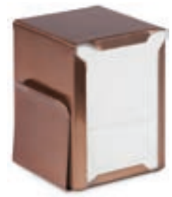
Cod. 8059C Con portacartas