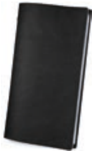
Negro 0,6 / 0,8 / 1,5 mm