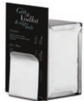
Cod. 8059 Todo inox Con portacartas