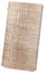
Blanco 2,5 mm