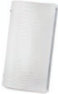
Cocodrilo Blanco 1,2 mm