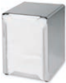
Cod. 8058 Todo inox