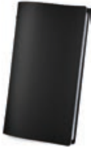
Negro 1,2 mm