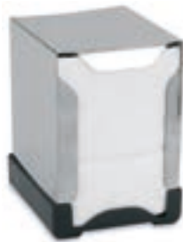
Cod. 8060 Inox - Base plástico